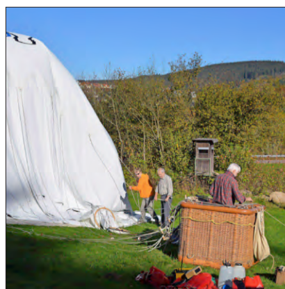
Der sicher wieder gelandete Ballon wird abgebaut und verstaut.