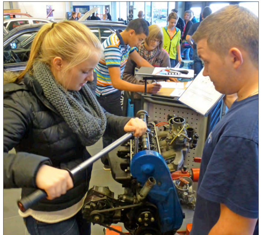
In der Autowerkstatt erspürt eine Schülerin, welcher Gespür man braucht, wenn man Schrauben anzieht.