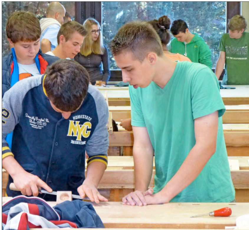
In der Holzwerkstatt der Hans-Thoma-Schule vervollständigen Schüler unter den Augen junger Schreiner einen Kerzenständer.